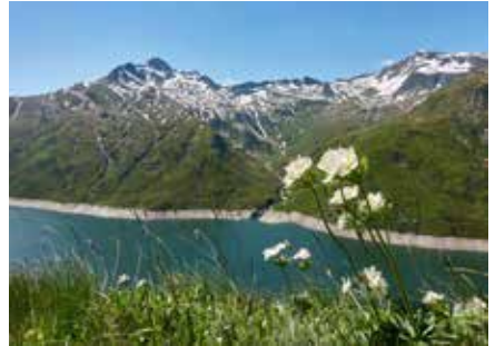
Lukmanier Stausee, Piz Rondadura