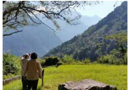
Blick auf Yu Shan (3952m) der höchste Berg Taiwans

Referenten: Wolfgang Wenghoefer Beate Porr Ort: Luise-Rodrian-Haus Beginn: 20 Uhr