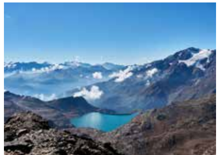
Monte Vioz, Lago Careser